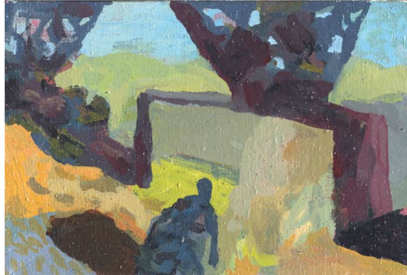
La guerre des Mondes